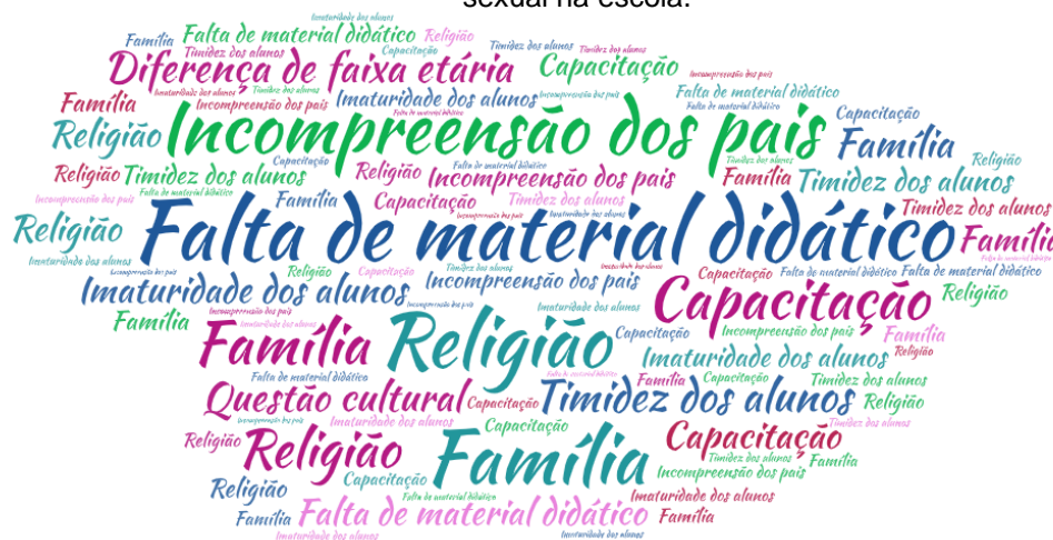
Figura 02: Nuvem de palavras – Dificuldades apontadas pelos professores no ensino da educação sexual na escola.

(80%) indicam que a falta de material didático (40%), a incompreensão dos pais (33,3%) e a religião (33,3%) são os maiores impedimentos quando se trata do ensino da educação sexual, alguns até reconhecem a necessidade de qualificação/capacitação (13,3%), a timidez e imaturidade (26,6%) dos alunos também são destacadas, como mostra a nuvem de palavras apresentada abaixo (Figura 02). Cada participante pôde elencar mais de uma dificuldade, por isso o somatório das porcentagens ultrapassa 100%. Enquanto 3 professores (20%) alegaram não ter dificuldades quanto ao assunto.